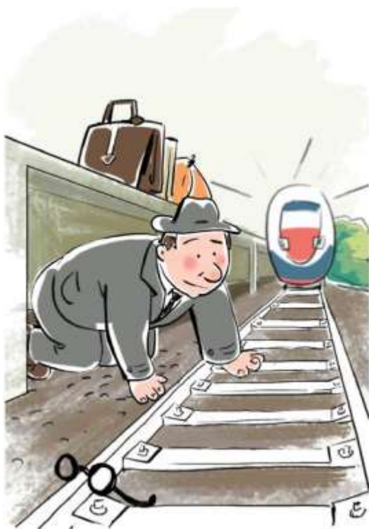
Не подлезайте под платформы и железнодорожные составы!